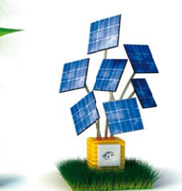
+ 20% Solaire