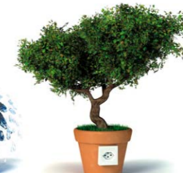
+ 25% Biomasse

Les énergies de demain avec le 3 Mix Premium + CHF 10.-/ mois HT* naturemade star!